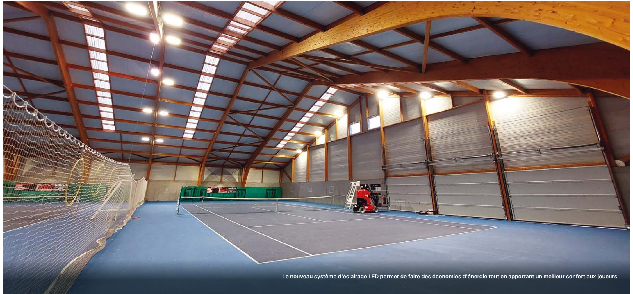
Le nouveau système d'éclairage LED permet de faire des économies d'énergie tout en apportant un meilleur confort aux joueurs.

Ces améliorations reflètent l'engagement de la municipalité envers le développement des activités sportives et l'amélioration de ses infrastructures sportives.