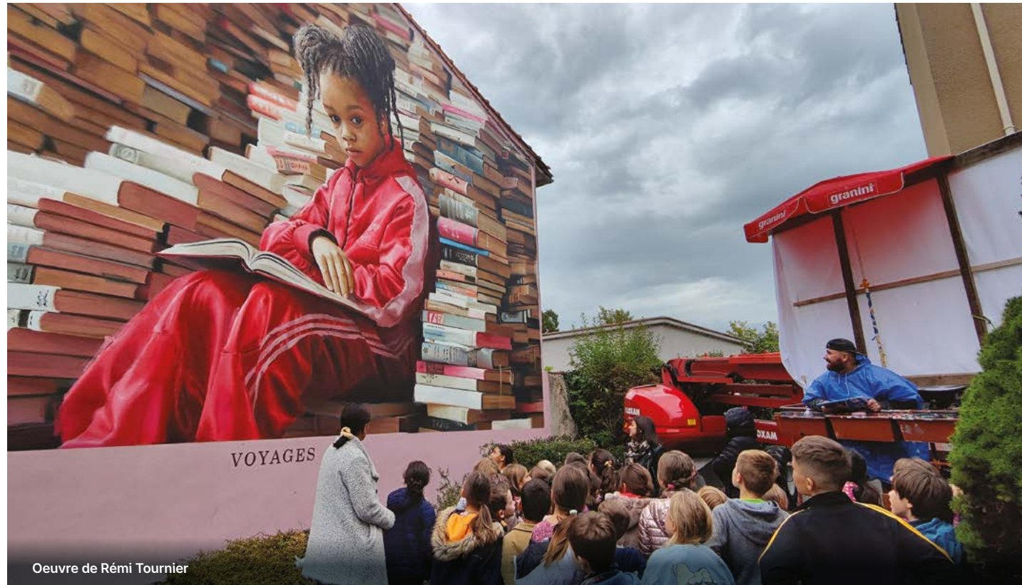
Oeuvre de Rémi Tournier