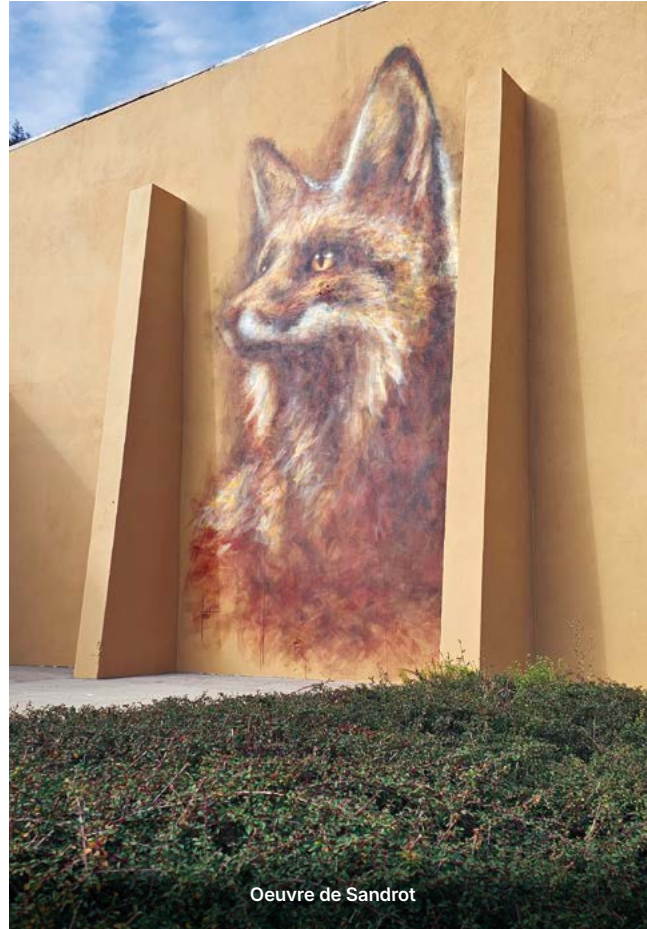
Oeuvre de Sandrot

Retour en images sur cette 5 ème édition colorée autour de 6 artistes de talent.