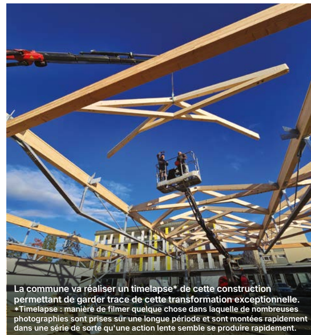
La commune va réaliser un timelapse* de cette construction permettant de garder trace de cette transformation exceptionnelle. *Timelapse : manière de filmer quelque chose dans laquelle de nombreuses photographies sont prises sur une longue période et sont montées rapidement dans une série de sorte qu'une action lente semble se produire rapidement.

1150 m 2 d'espaces végétalisés avec 89 arbres plantés