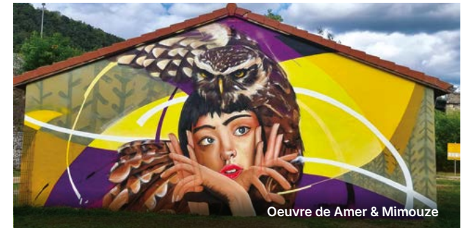
Oeuvre de Amer & Mimouze