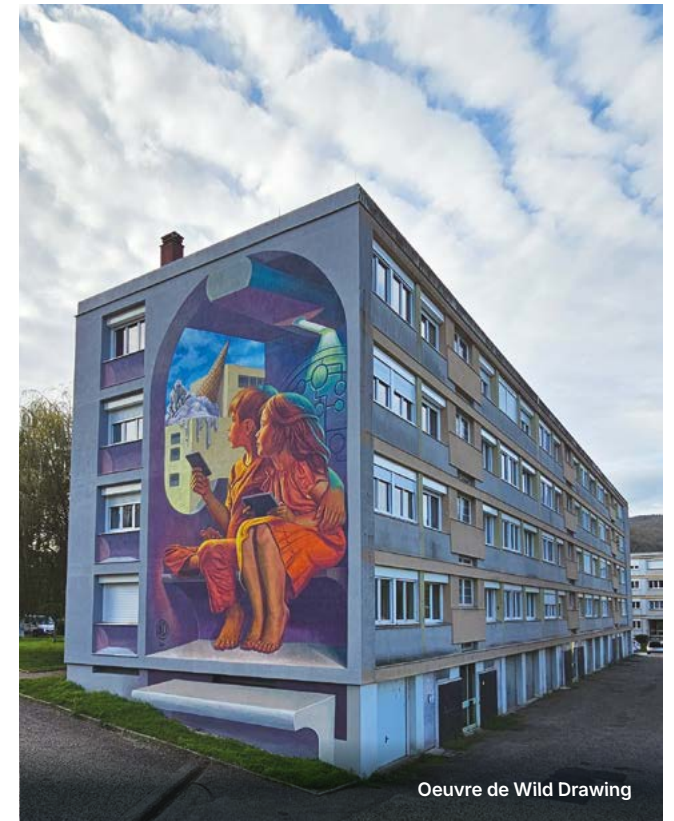
Oeuvre de Wild Drawing