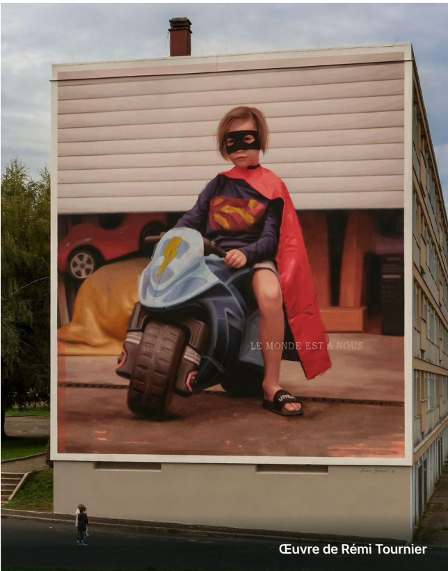
Œuvre de Rémi Tournier