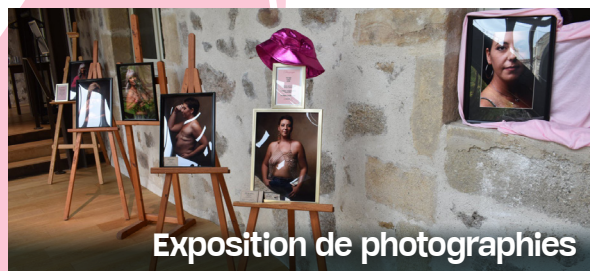
Exposition de photographies

Le comité des fêtes Gala et les Amis du Vieil Aurec ont organisé un concours de gâteaux gourmands, utilisant des pommes issues du verger conservatoire. L'événement a rencontré un succès inattendu, avec près d'une vingtaine de pâtisseries vendues au profit d'Octobre rose.