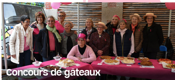
Concours de gâteaux

Le Football Club Aurec a organisé son premier tournoi féminin, où chaque équipe a joué 7 matchs de 16 minutes lors d'une journée conviviale et sportive.