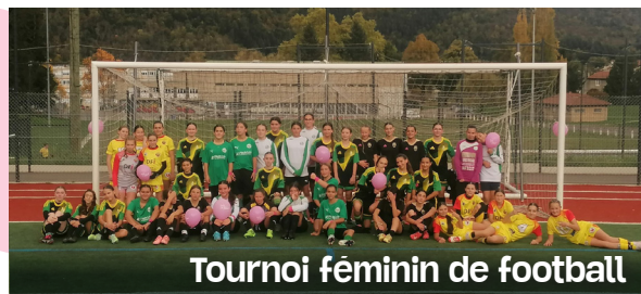
Tournoi féminin de football