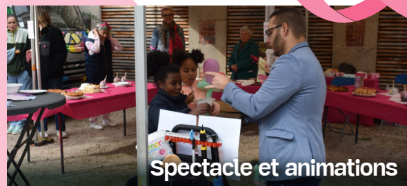
Spectacle et animations

Les visiteurs ont pu assister à des conférences et démonstrations de shiatsu, magnétisme et Qi Gong pour soulager les effets secondaires des traitements.