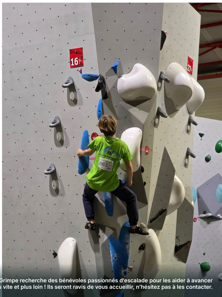
L'équipe du club Aurec Alti Grimpe recherche des bénévoles passionnés d'escalade pour les aider à avancer toujours plus vite et plus loin ! Ils seront ravis de vous accueillir, n'hésitez pas à les contacter.